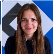
Gesa Breitensport- koordinatorin